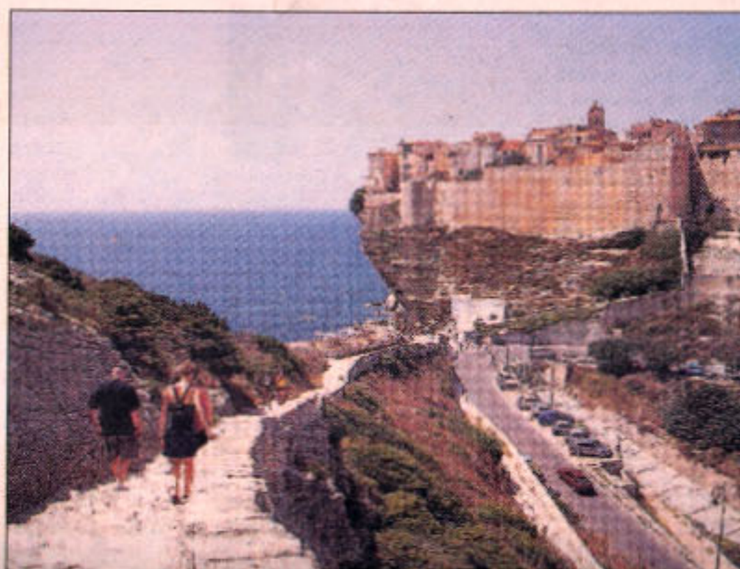
Byen Bonifacio hænger på en klippe på Korsikas sydspids.