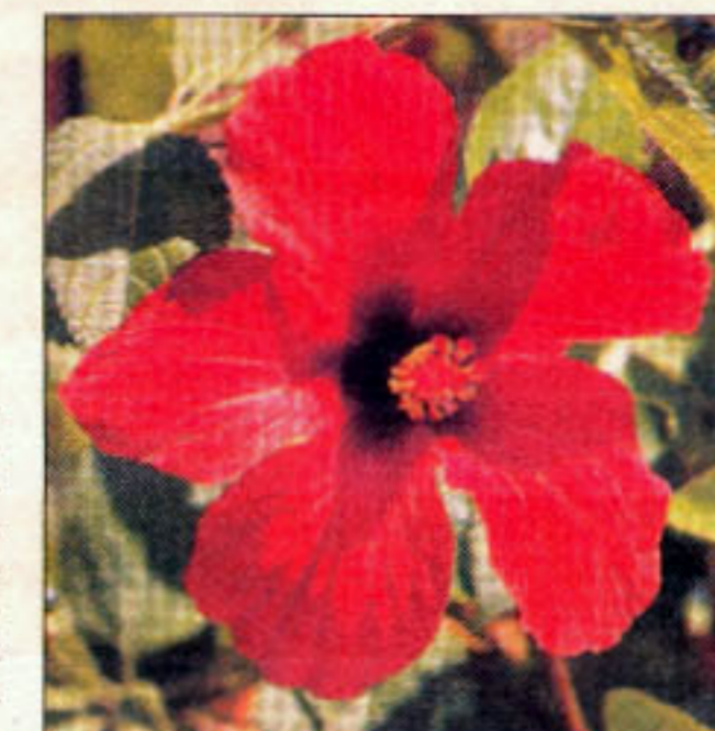
En hibiscusblomst i fuldt flor.