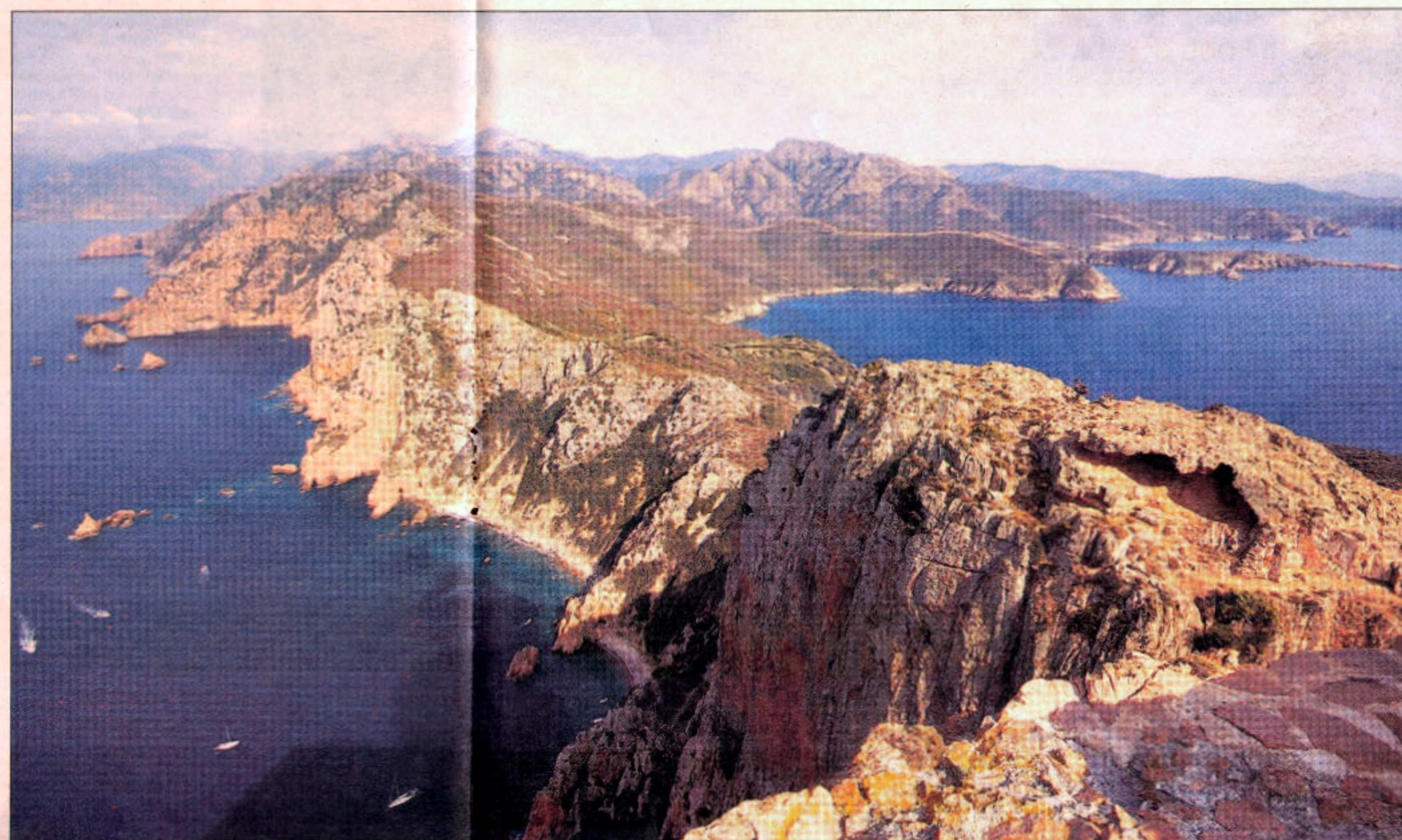
Udsigten over halvøen fra det tårn, der beskrives i indledningen.