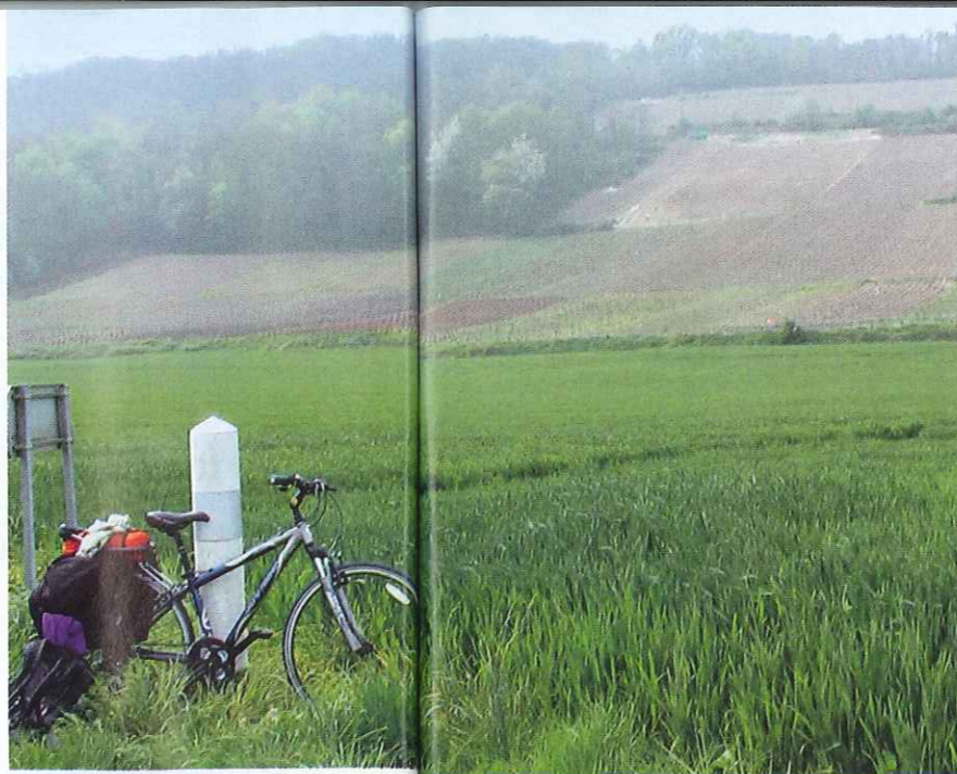
Det er oplagt at tage cyklen på de små veje rundt i regionen.

Der er mange små og større seværdigheder drysset ud over Champagne-regionen. Frankrig er kendt for at have turistkontorer selv i små byer, og denne region er ingen undtagelse. Stik hovedet indenfor