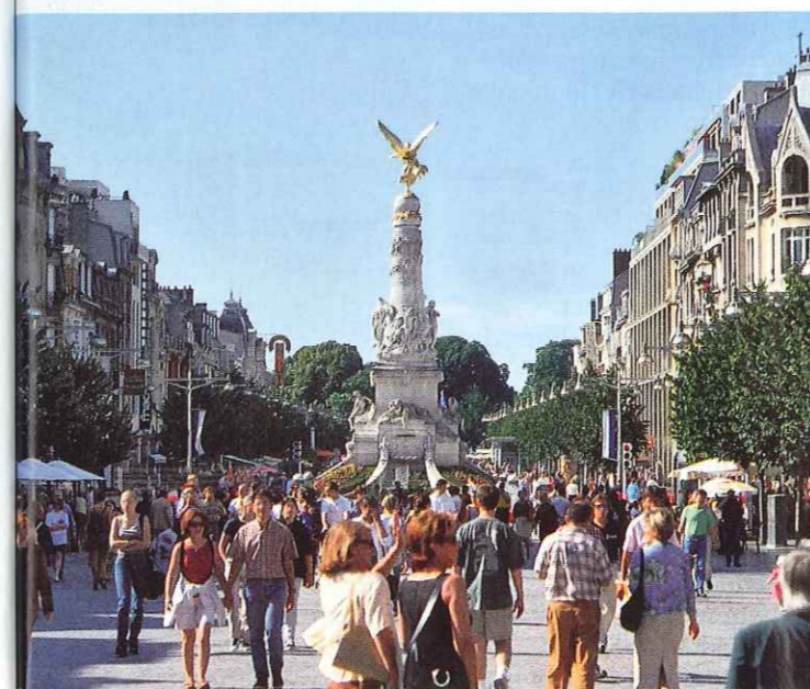
Reims er regionens hovedby med flotte facader og statelige pladser.

der er også skægt at smage gode champagner fra små producenter eller kooperativer, der kun producerer til det franske hjemmemarked og ikke kan købes herhjemme.