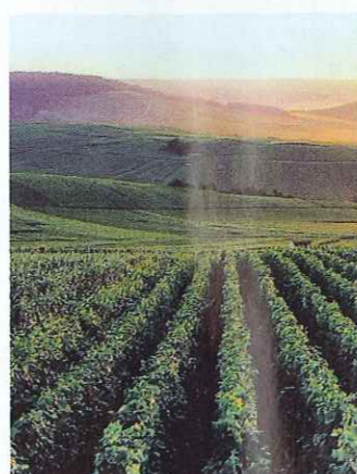
Du får mange stemningsfulde billeder med hjem fra en ferie i Champagne.