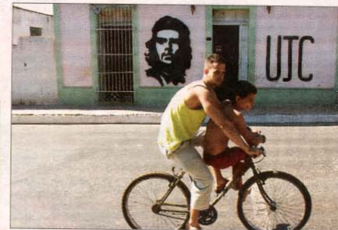
Cyklen er cubas vigtigste transportmiddel her med revolutionens ikonet Che Guevara i baggrunden.