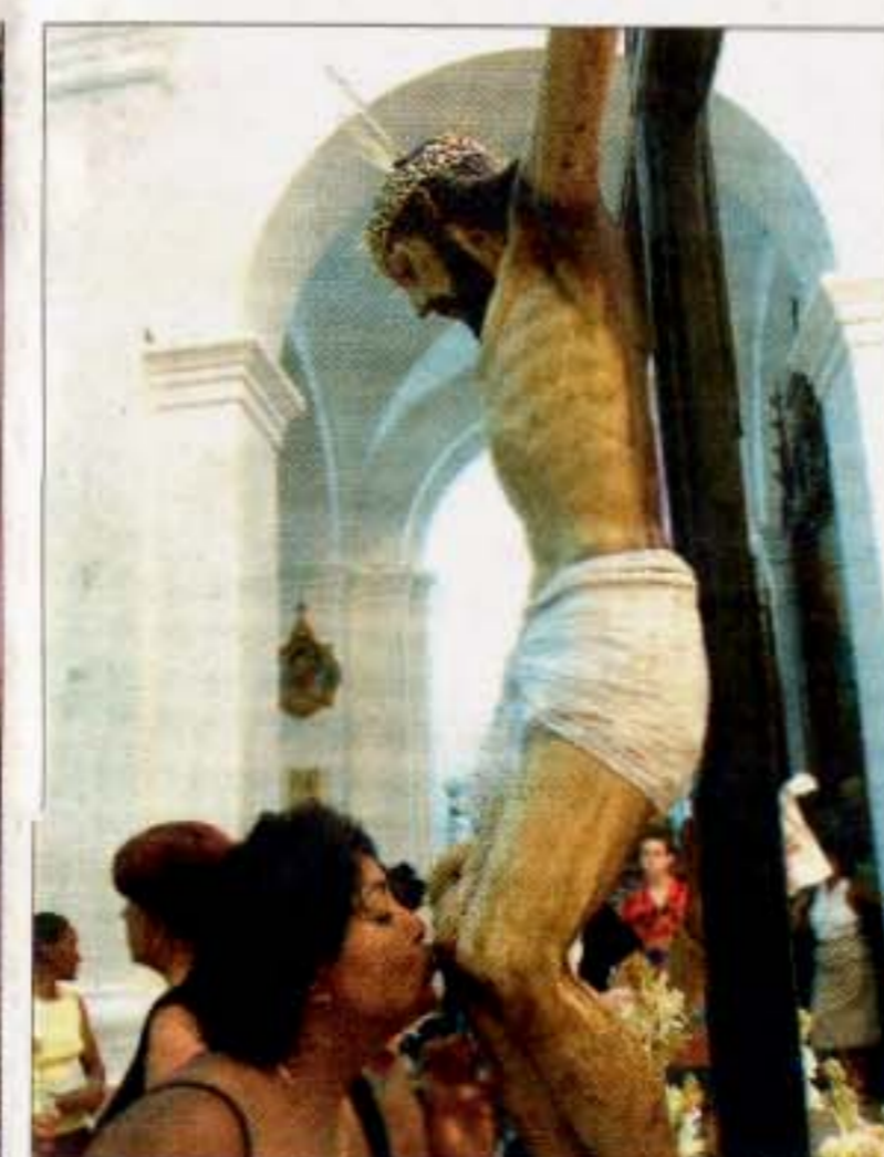
Lokale står i kø for at kysse knæene på Jesus-figuren i La Santísima Trinidad kirken.

Oplev også Escambray-bjergenes fugtige klima og frodige vegetation som en forfriskende kontrast til byen og stranden. Topes de Collantes ca. 20 km fra Trinidad er et af Cubas bedste områder til at spotte bl.a. kolibrer, spætter, nationalfuglen torcororo foruden papegøjen cotorra cubana, der er endemisk for Cuba. En guidet tur gennem en af Topes de Collantes' tre naturparker Colina, Caburní eller Guanayara bringer dig også i nærkontakt med smukke blomster som engletrompet, orkideer, liljer og hibiscus. På en tur ind i regnskovens hjerte kan man desuden gå på opdagelse i klippehuler, klatre ned langs brusende vandfald og bade i kølige, smaragdgrønne pools. En fortryllende oplevelse, der understreger, at Cuba også er en spændende rejsedestination til trekking og store naturoplevelser.