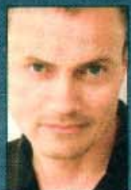
TEKST OG FOTO: OLE LOUMANN