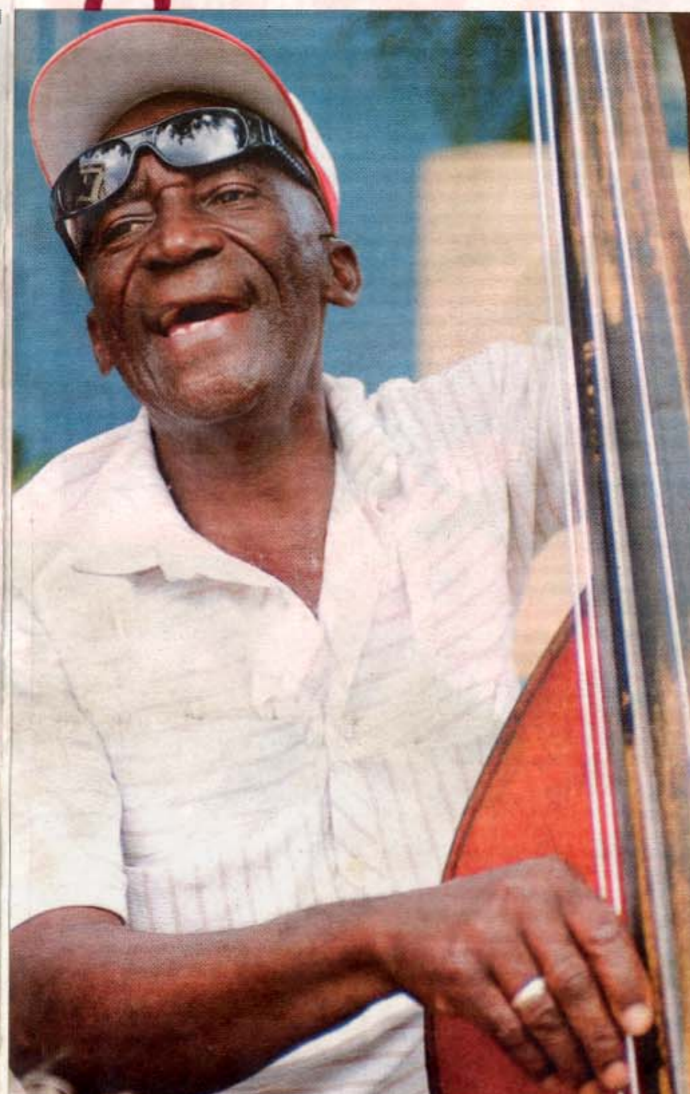
Der er noget særligt over gamle gubber, der trykker den fede musik af.