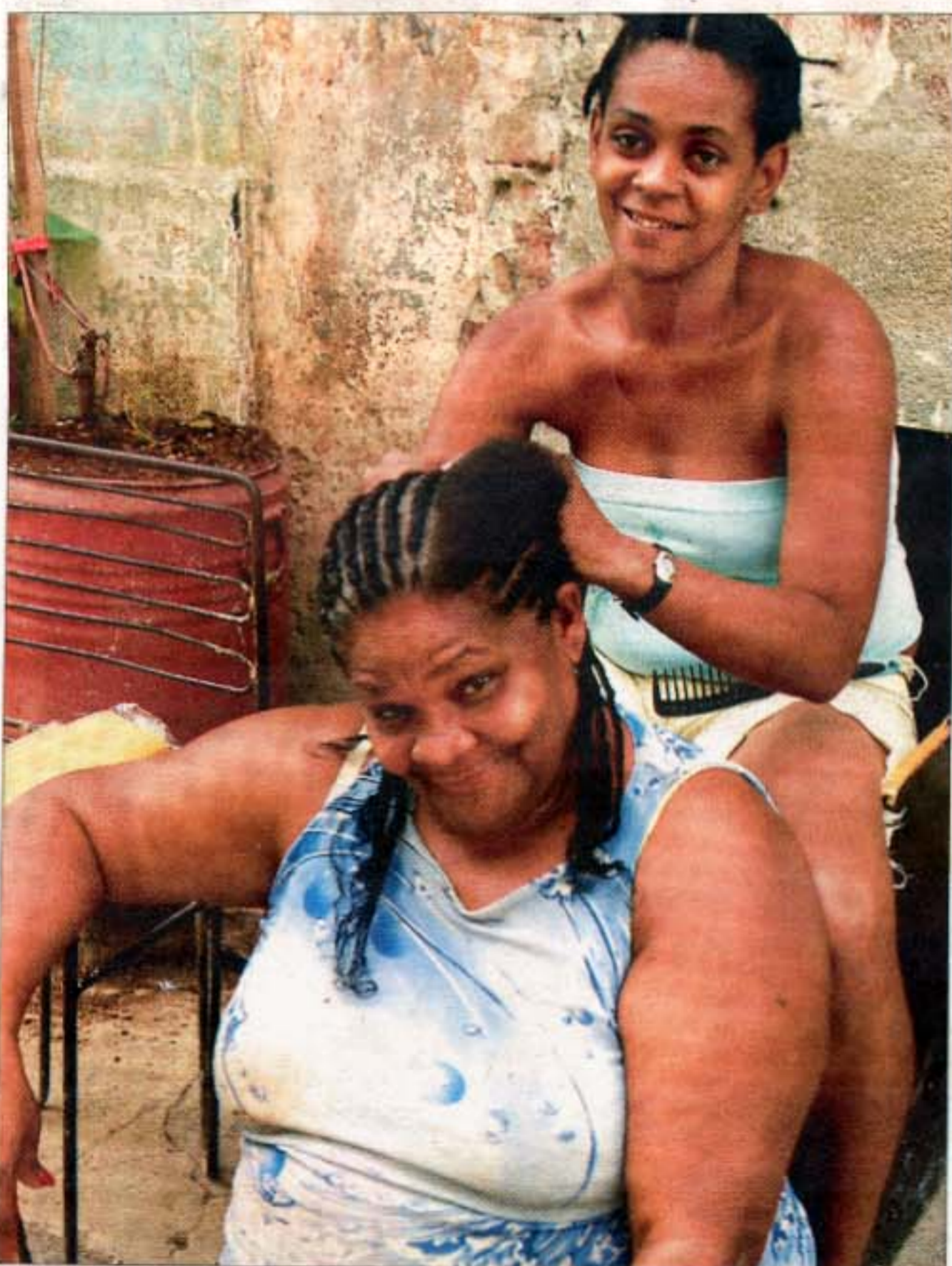
Der flettes rasta-hår på gaden med et smil.

udført af ældre mænd med evigt unge musikgener. Palenque de Los Congos Reales byder på afrocubansk rumba. Og endelig er der Casa de la Música, hvor turister hver aften fra kl. ca. 22 hænger ud på trapperne eller får sig en svingom med lokale latinajid og salsahajer til toner fra son- og salsakoncerter under stjernerne på den tropiske himmel. Når de udendørs lejer slutter ved 01-tiden, kryber man indenfor i Casa de la Música og danser fræk og tæt reggaeton, eller man drager videre til endnu et reggaeton-tempel i klippehule-templet Disco Ayala dybt inde i bjergene et lille stykke bag byen.