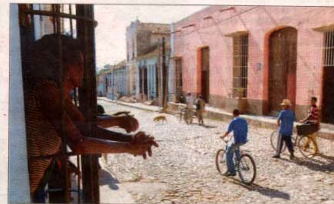
Gadelivet observeres gennem store vinduer med træmer