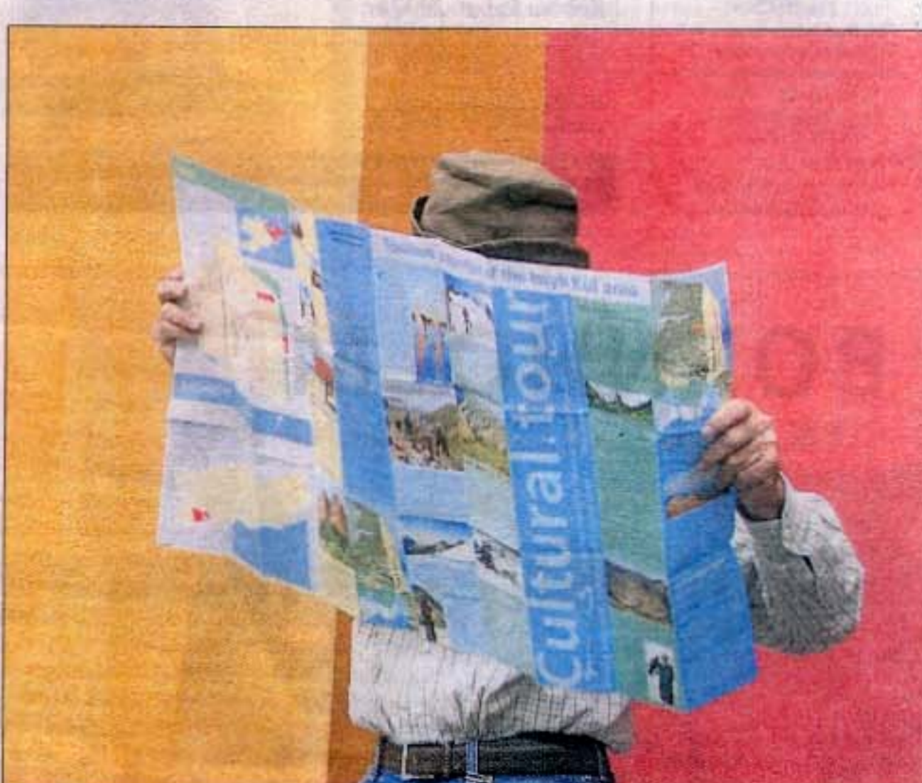
Det er ikke sådan lige at finde rundt på egen hånd.

Langs vor synsrand rejser de flotteste bjerge sig. Alt er grønt. Alene blomsterne iklæder sig andre farver. Og så er grønt alligevel en bred palet af farveindtryk. Fra sollysets sarteste farver til det dunkleste mørke, hvor de tætteste skygger falder. Længere fremme, hvor terrænet hæver sig op mod den blå himmel med drivende skyer, løfter bjergets brun-grå stenmasser sig fra den grønne sætermark for at række sin sneklædte top op i den høje blå himmel. Alt er så smukt og betagende, at vi glemmer trætheden i benene. Her er ikke spor af menneskeligt