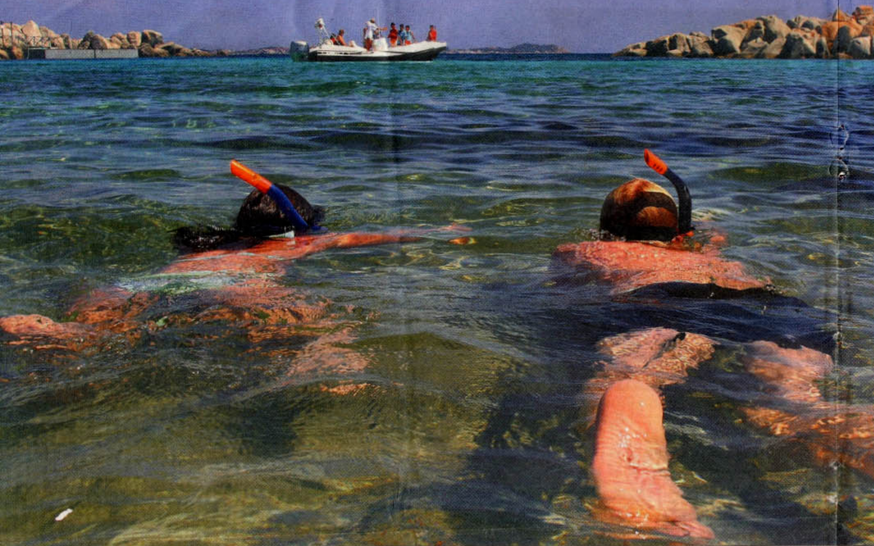
Masser af steder langs kysten er der basis for en snorkletur i det klare vand. Inden længe bliver man fulgt af en nysgerrig fiskestime.