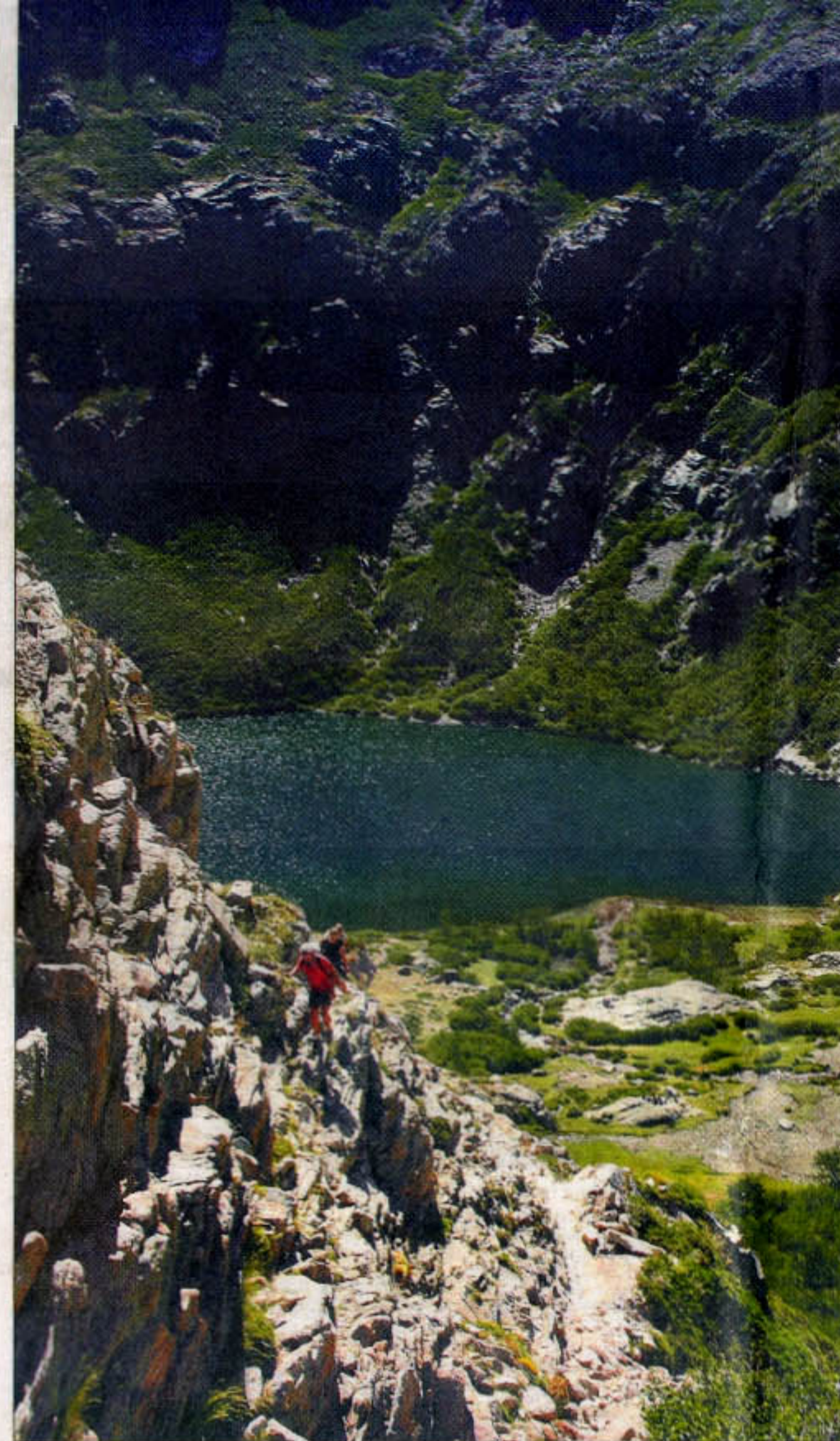
Turen op til Lac de Melo i bjergene ved Corte er hård men sliddet værd. Husk vand.

Pust eksempelvis ud i Corte - universitetsbyen