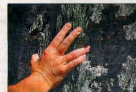
Korkegen kan ses i bjergene.