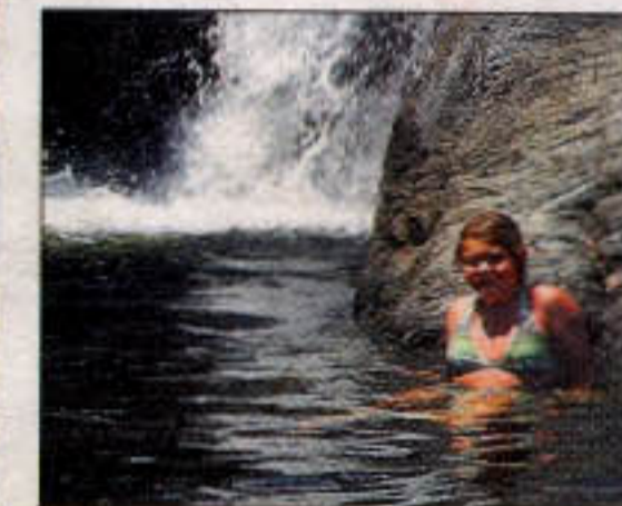
Djævlens hul - en lille oase i bjergene. Bare en times cykeltur fra kysten kan man finde fred, ro og køligt klart vand med eget vandfald.