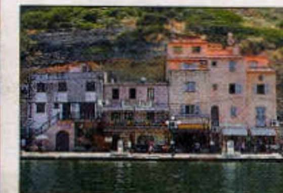
Bonifacio på øens sydspids er et malerisk syn, når man sejler ind fra søsiden.

Der er altid en bjergflod et sted med fossende køligt vand - og det er rent - hvor man kan finde sit eget svømmebassin med privat vandfald.