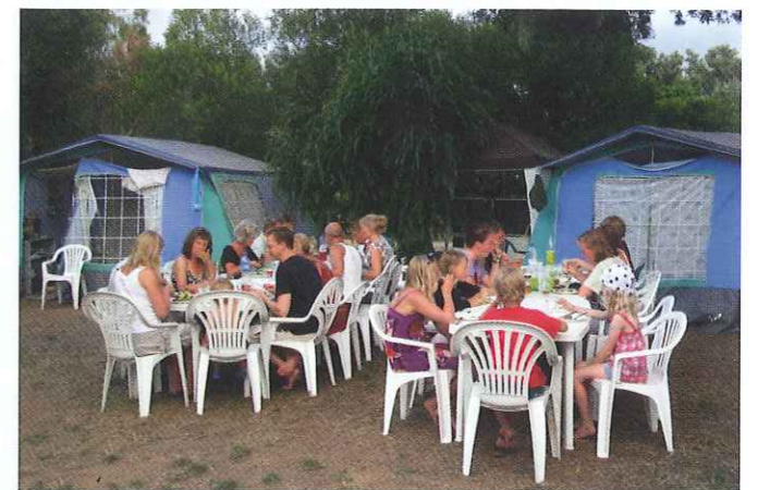
Hygge på campingpladsen.

Blandt de populære udflugtsmål for campisterne på campingpladsen i Calvi er en 25 kilometers togtur til den lille by Ile Rousse, der blev grundlagt af frihedshelten Pascal Paoli i 1758. Den har kun 3.500 indbyggere men et betydeligt opland. Derfor virker