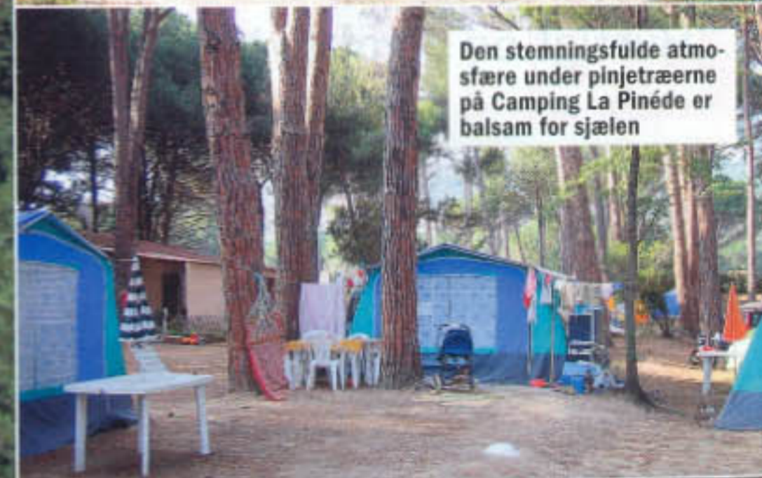
Den stemningsfulde atmosfære under pinjetræerne på Camping La Pinède er balsam for sjælen

lede, små gyder, hvor hyggelige butikker og små restauranter ligger side om side. Prøv de himmelske pizzaer på La Main a la Pate til mellem ni og 12 euro.