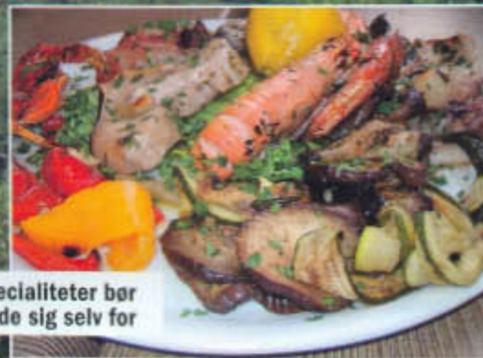
Øens fiskespecialiteter bør man ikke snyde sig selv for

Vi rejste på flycamping med Ruby Rejser, hvor en returbillet for to voksne og et barn over 12 samlet koster omkring 16.500 kr. for fly tur/retur og et fuldt udstyret telt i to uger.