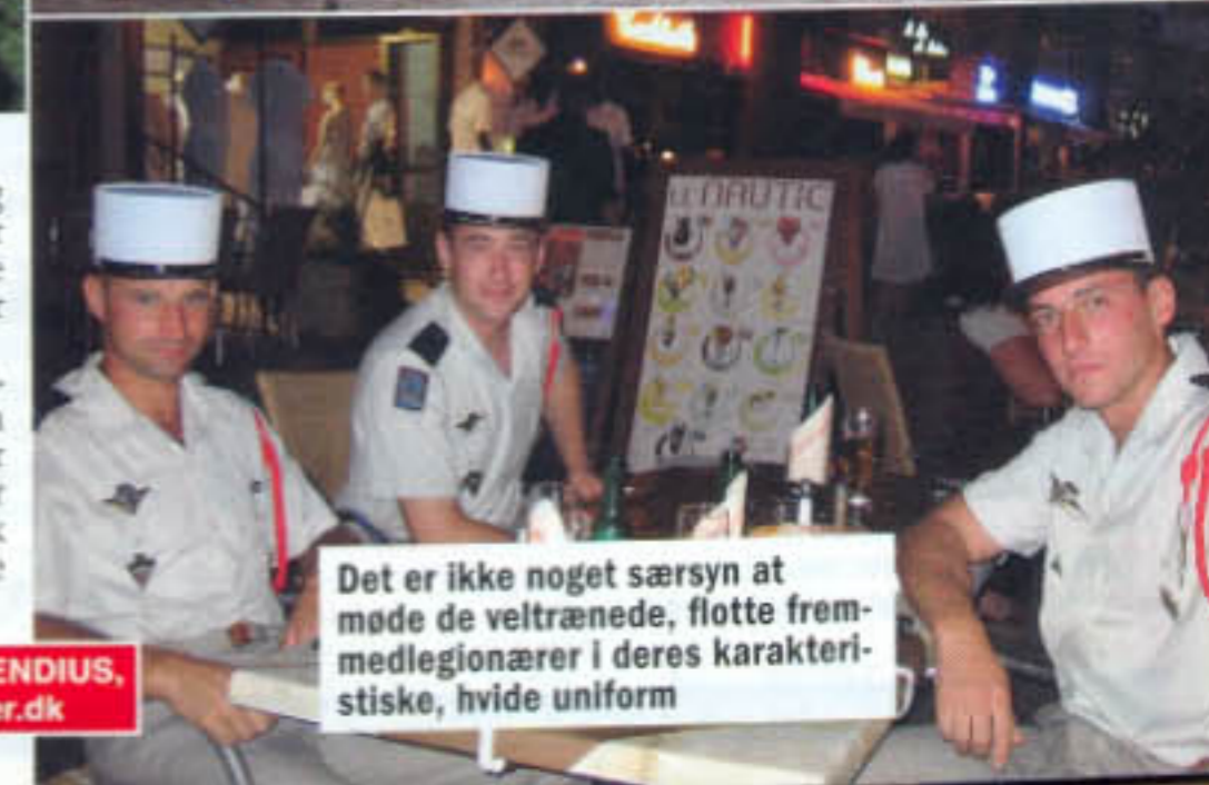
Det er ikke noget særsyn at møde de veltrænede, flotte fremmedlegionærer i deres karakteristiske, hvide uniform

Korsikanere er et stolt folkefærd, som elsker deres ø, og som noget ganske sjældent holder de altid tilbage i trafikken og er gode for en lille sludder. Så husk at lovprise øen – så vil de stolte beboere huske dig fremover!